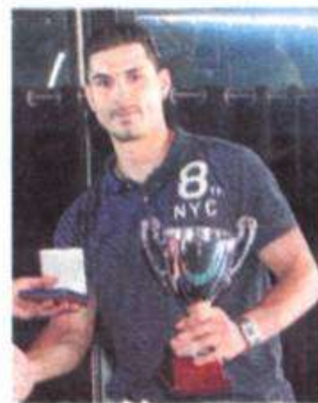
CEP Coruña, equipo menos batido