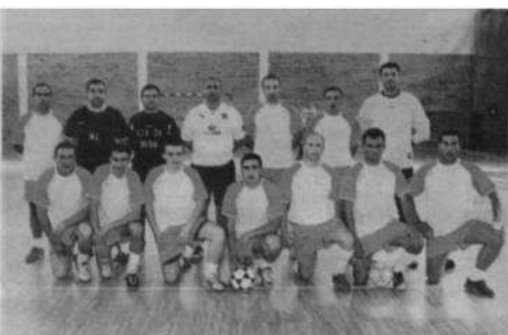
Esquadra de Santiago de Custos de Oporto