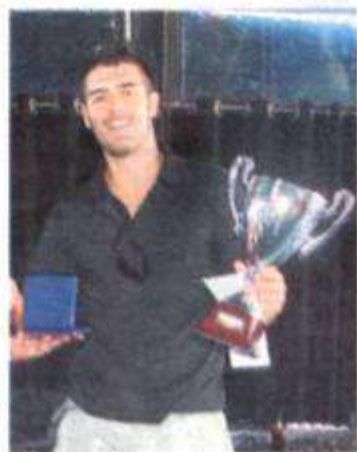
CNP Marbella terminó segundo