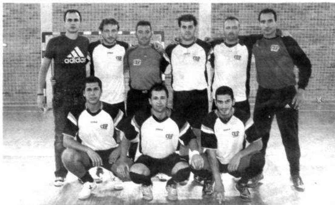
CEP Coruña lidera el grupo A de este campeonato con cuatro puntos tras disputar dos partidos