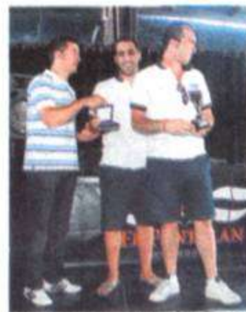
CEP Madrid finalizó de sexto