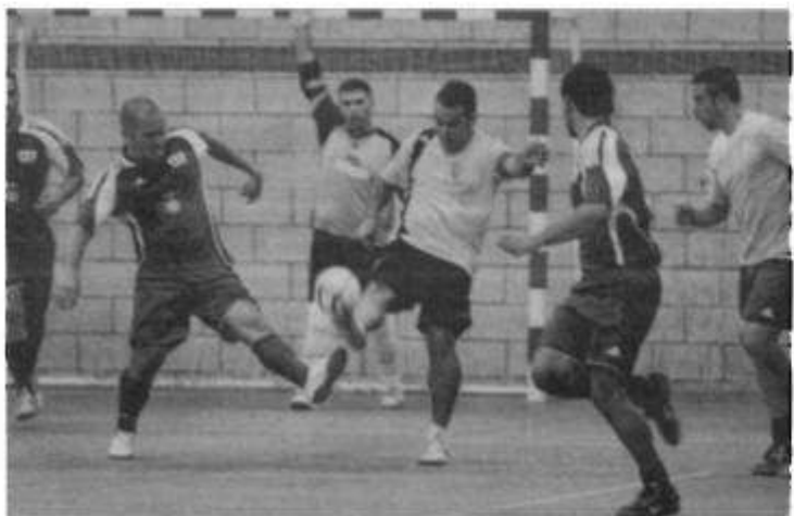
El Afupol de Madrid fue el mejor equipo del torneo