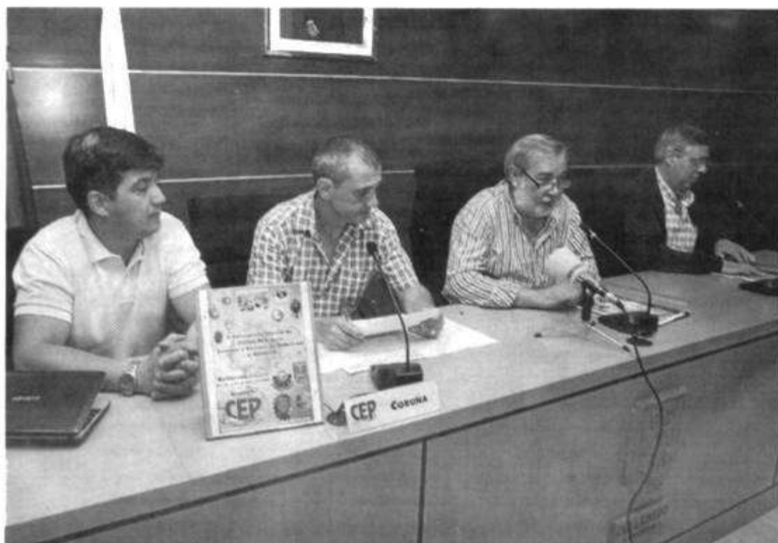
El Concello de Culleredo colabora en la primera edición de este novedoso evento deportivo

■ Más de treinta El comité organizador de la primera edición de este torneo ha programado la disputa de un total de treinta y tres encuentros que se celebrarán desde la tarde de hoy viernes hasta el mediodía del domingo.