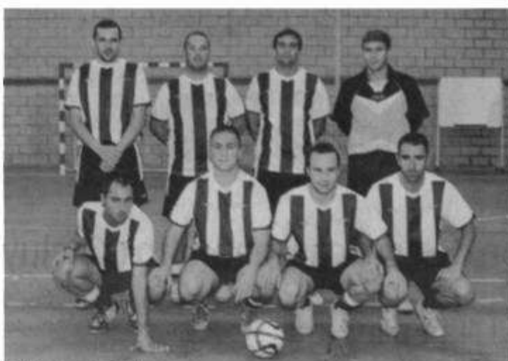
Policía Local de Culleredo