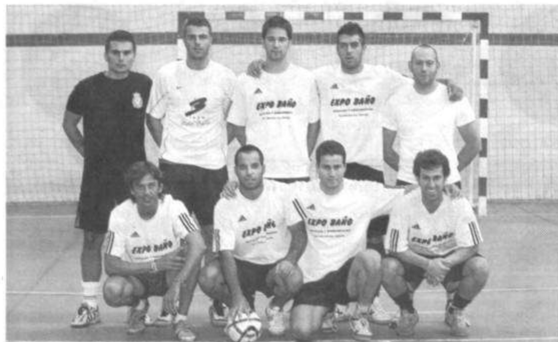
CNP Marbella terminó primero en el grupo A y se verá en los cuartos de final con Policía Local Culleredo