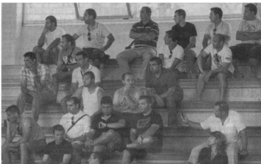
El público no faltó y asistió en gran número a los encuentros programados del campeonato