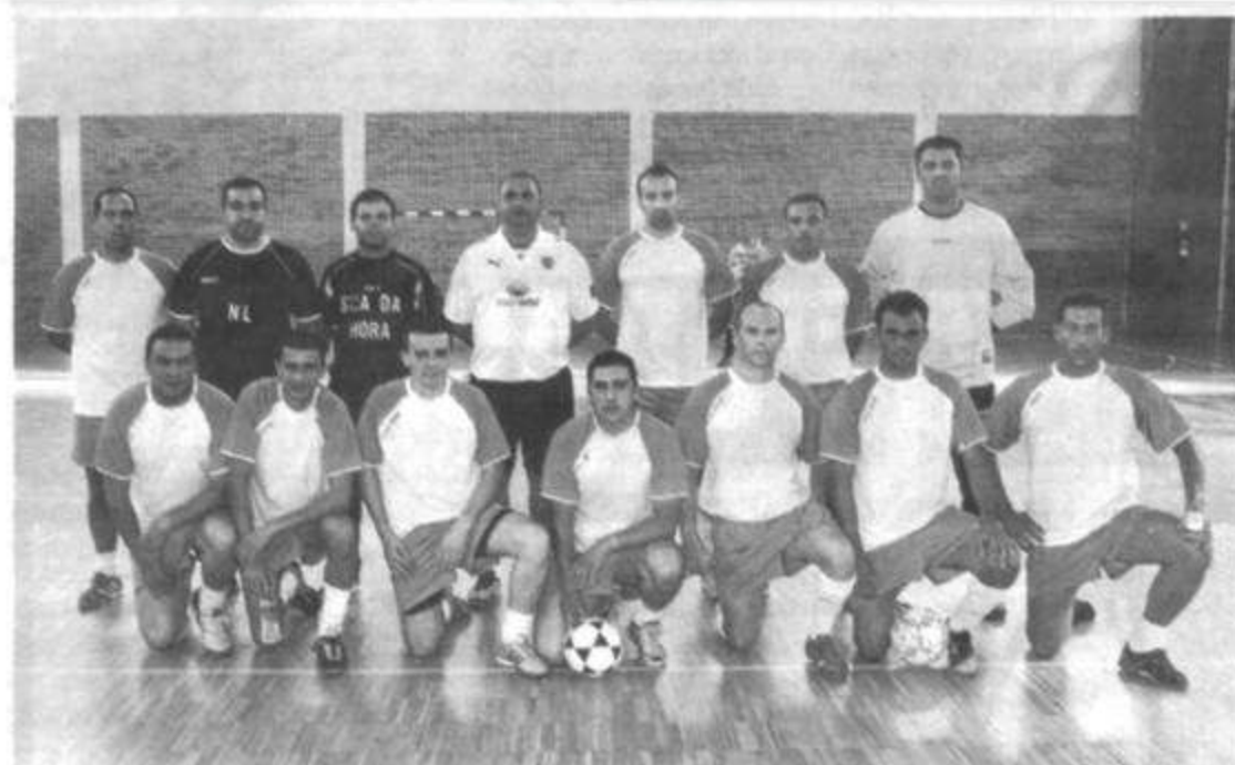
La Escuadra Santiago Custois de Oporto se jugará hoy ante Afupol su pase a semifinales

Las formaciones del Destacamento de Tráfico Barajas, Guardia Civil de Cáceres y Real Coyón quedaron apeadas de la lucha por el título del campeonato al quedar eliminadas en la fase previa.