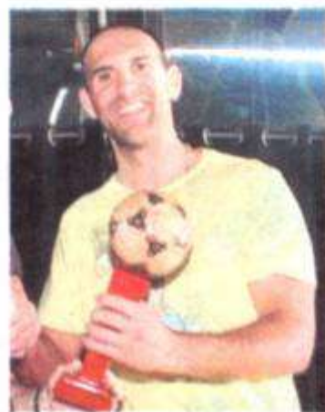
Currus, del CEP Coruña, el goleador