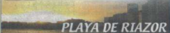
PLAYA DE RIAZOR