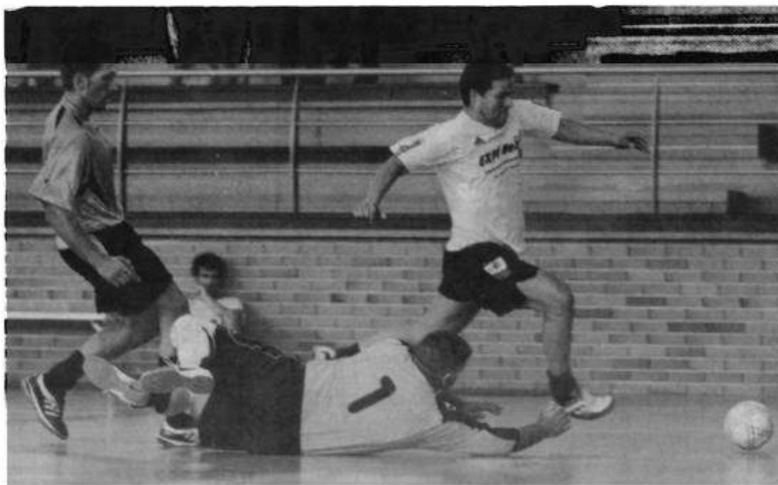
La final de la primera edición del torneo la protagonizaron el Afupol Madrid y el CNP Marbella

Por último, hay que mencionar que ninguna persona puede poner en duda de que este tipo de iniciativas deportivas son muy positivas y provechosas para los equipos y jugadores inscritos ya que están orientadas a todos aquellos a los que les une la afición y profesión, como son el fútbol sala y la seguridad pública.