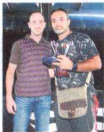
Policía de Vigo concluyó cuarto