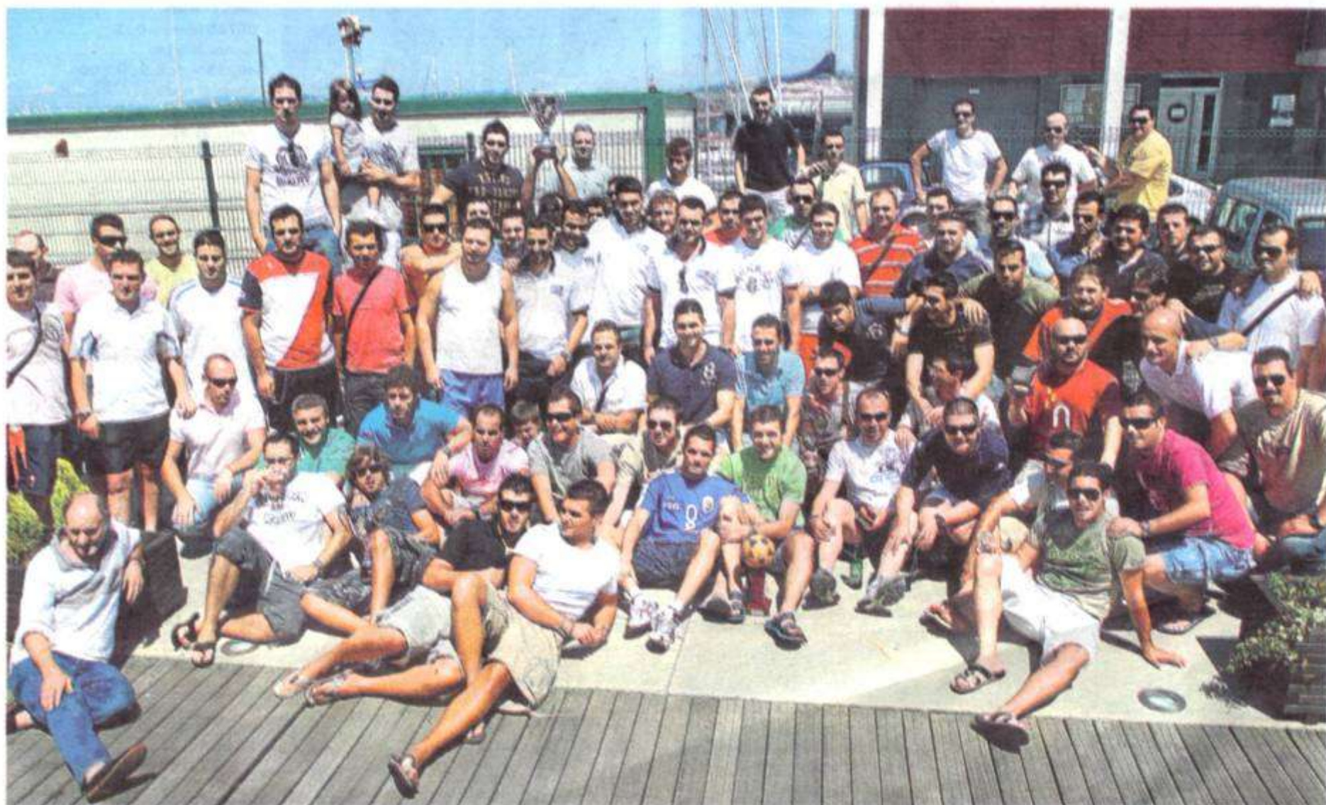
La totalidad de los participantes posaron al término de la entrega de trofeos con los galardones conquistados en la primera edición de este torneo de fútbol sala