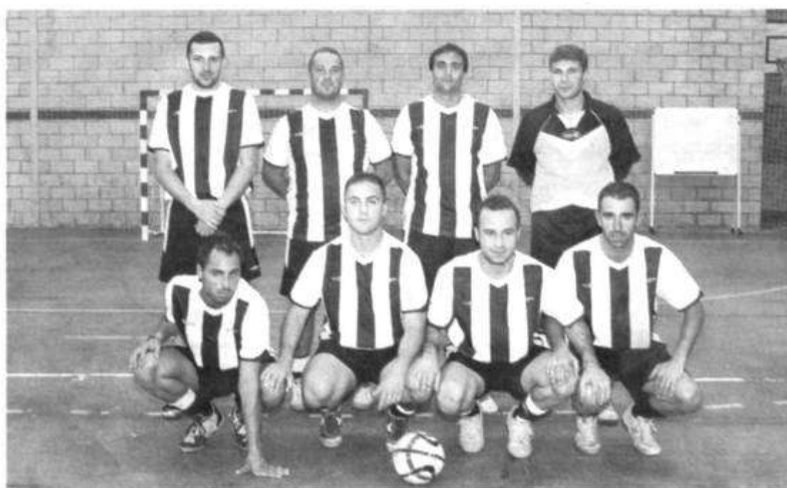
La Policía Local de Culleredo jugará hoy tres encuentros en la polideportiva de O Burgo