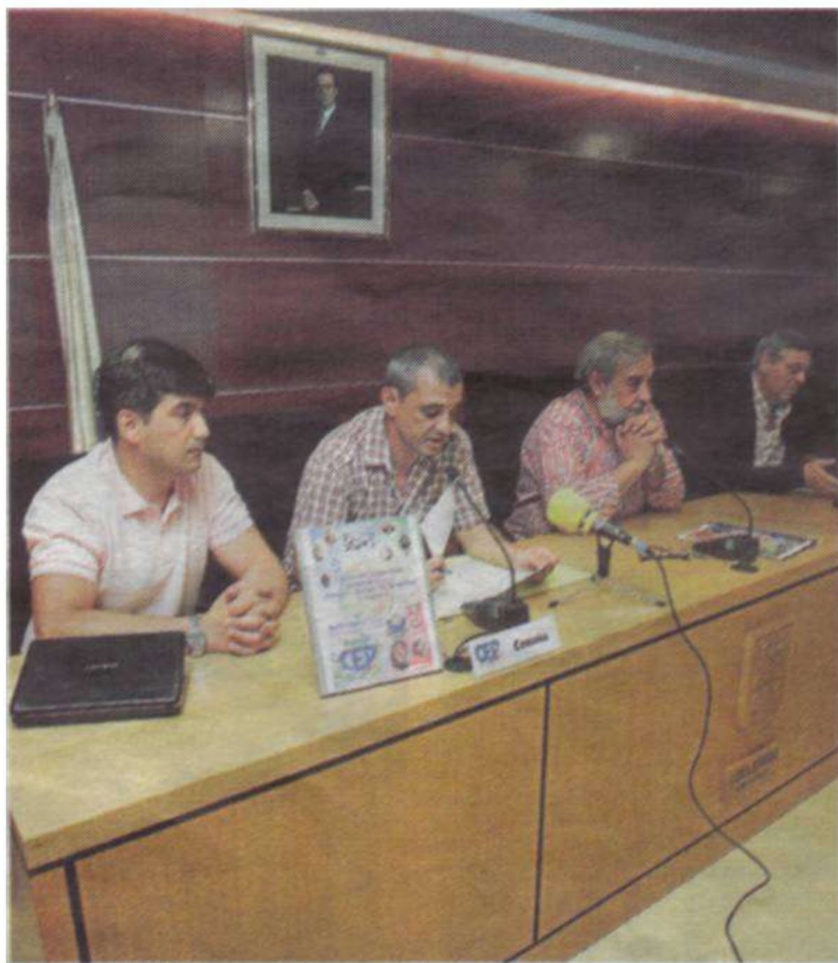
La presentación se realizó en el Concello de Culleredo

El campeonato, que dará inicio mañana viernes y se prolongará hasta el domingo, contará con la participación de once equipos que estarán divididos en dos grupos: el A con cinco y el B con los seis restantes. Galicia tendrá representación en este primer certamen con el concurso de tres conjuntos: CEP Coruña, Policía de Vigo y Policía Local de Culleredo. Además, participarán otras tres escuadras de la comunidad de Madrid, dos vascas, una extremeña, otra andaluza y la última de la ciudad portuguesa de Oporto.