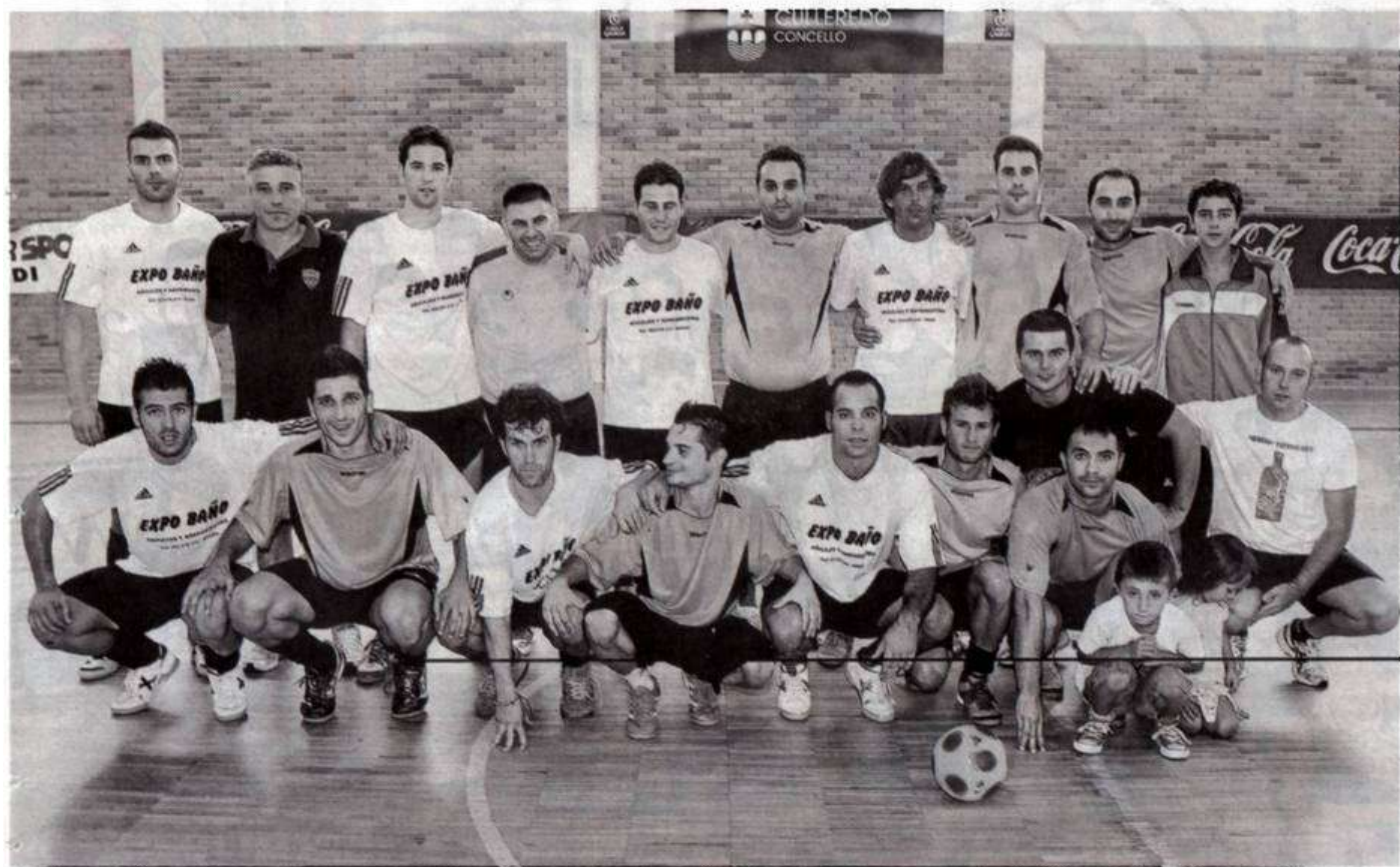
Los dos finalistas posaron juntos sobre la cancha de juego de la polideportiva de O Burgo al término de la gran final de este novedoso evento deportivo