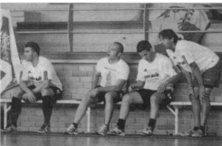
El cansancio se vio reflejado en los rostros de los finalistas