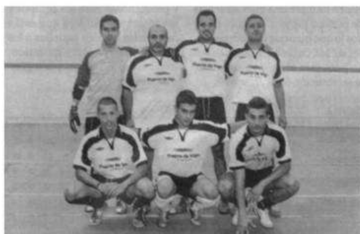
Policía de Vigo