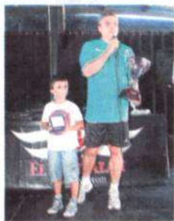
Afupol fue el campeón del torneo