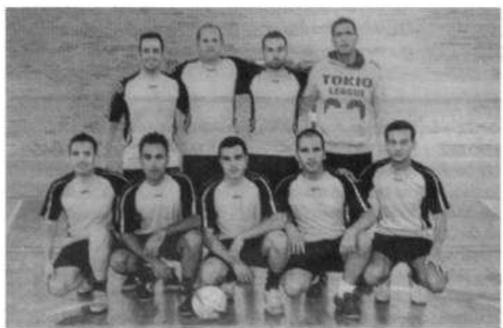
Loiu Aireportua de Bilbao