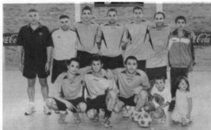
Afupol CM (Policía Locales de Madrid)

El partido decisivo, el que todos querían jugar, se vio un equipo muy superior al otro, a pesar de que el cansancio acumulado hizo mella en los dos planteles durante el tiempo reglamentario. Afupol CM de Madrid demostró ser el mejor del campeonato y se impuso por un claro cuatro a uno.